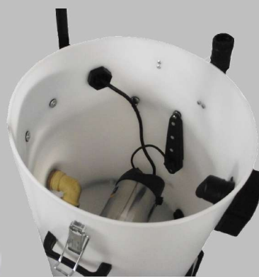
mit eingebauter Pumpe

Wasser aufsaugen und abpumpen gleichzeitig