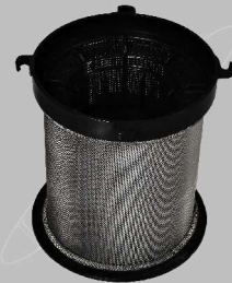
Spänesieb incl. Einbausatz optimal zum Schutz vor Metallspänen z.B. beim absaugen der Kühlflüssigkeit von CNC - Maschinen