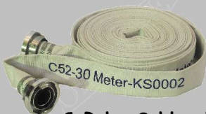
C-Rohr-Schlauch 10,20 und 30 Meter beidseitig mit Kupplung zum abpumpen von großen Wassermengen