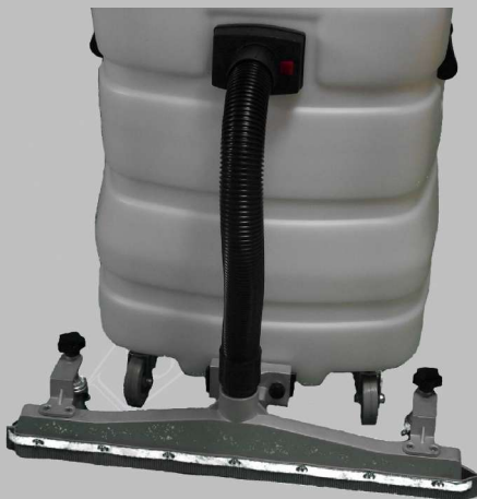
Saugmobil 65 cm Optimal für große Flächenabsaugung