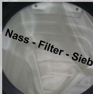
Verschmutzungen im Wasser sicher ausfiltern. Die Funktionsweise ist ähnlich wie bei einem Dauer-Kaffeefilter! Nach Benutzung entleeren und wiederverwenden