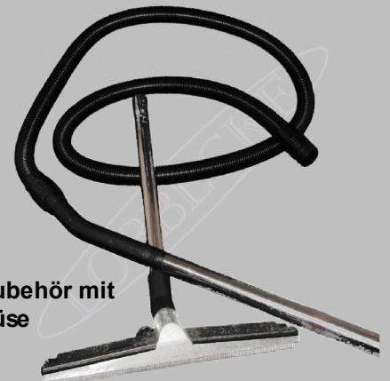
Sonderzubehör mit Wesseldüse